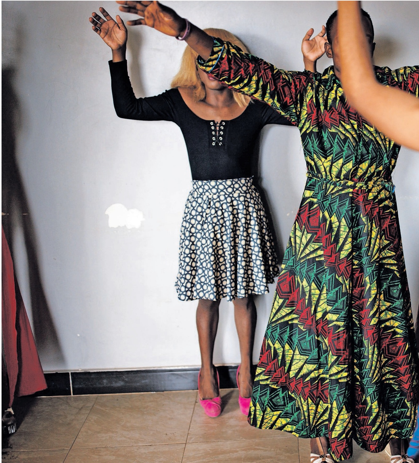
Transgender vrouwen wonen een evangelische dienst bij in een schuilkerk in de Oegandese hoofdstad Kampala,

De inkomsten van zijn stichting, die Van Schothorst beheert